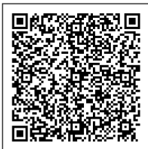
Ilustración 1 QR de ejemplo

https://catalogo-vpfe.dian.gov.co/document/searchqr?documentkey=e5bac48e354bc907bccff0ea7d45fbf784f0a8e7243b58337361e1fbd430489d